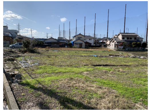
大阪府貝塚市 事業用地