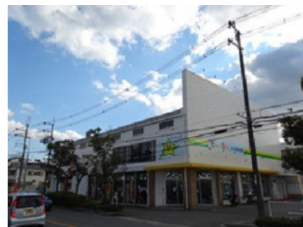
ECO スリフトショップ （枚方野村店）