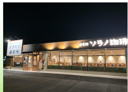
喫茶所 ソラノ珈琲 (滋賀県甲賀市水口町)