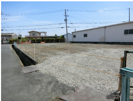
大阪府貝塚市 事業用地