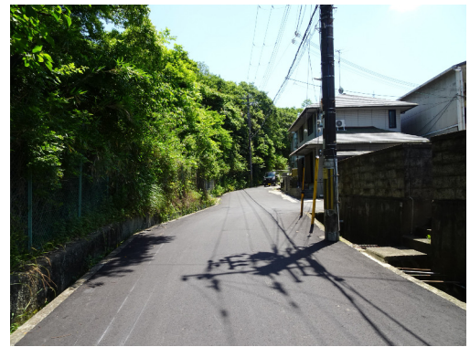
大阪府泉南郡岬町 山林