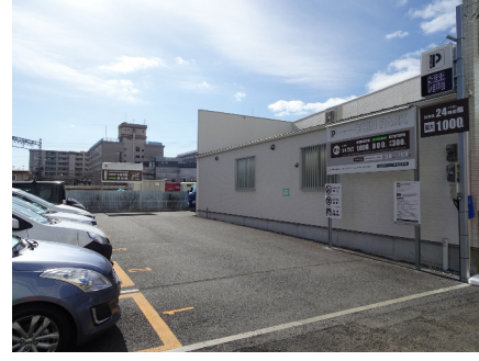
コインパーク (西大寺栄町)