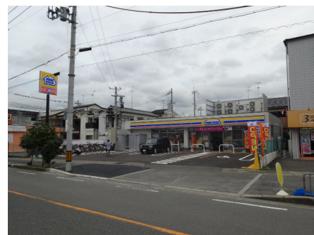
ミニストップ (高槻寿町1丁目店)