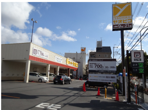
名鉄協商パーキング (奈良市富雄元町)