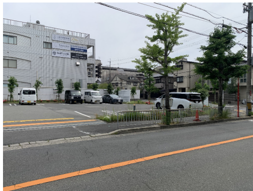
大阪府箕面市 土地（底地）売買