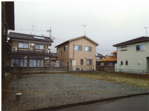
滋賀県高島市 駐車場用地