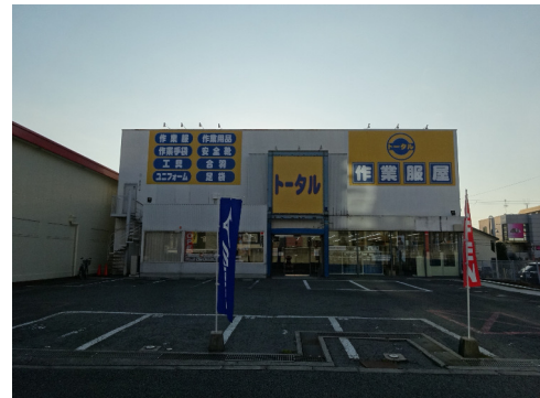
ワークショップ トータル (堺店)