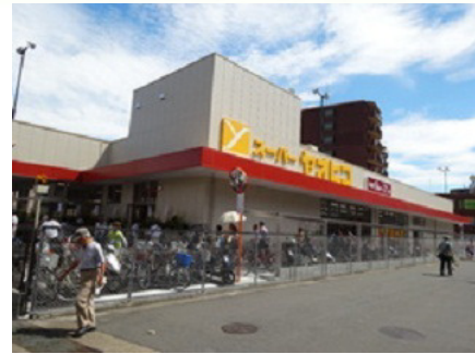
スーパーヤオヒコ（富雄店）