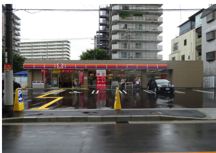
サークルK (鶴見横堤1丁目店)