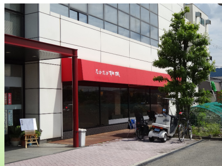
なかおか珈琲 (柏原店)