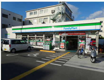
ファミリーマート （今川3丁目店）