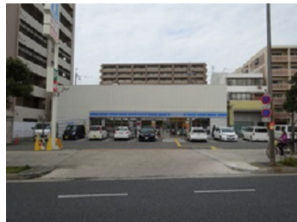
ローソン（横堤4丁目店）