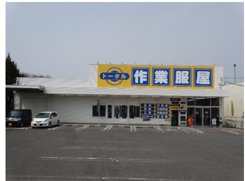
ワークショップ トータル (平群店)