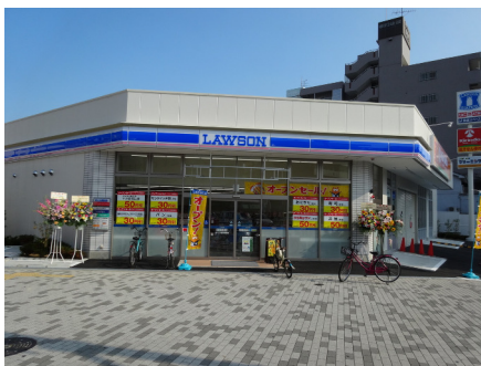
ローソン（岸里駅前店）