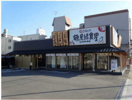
まいどおおきに食堂（緑食堂）