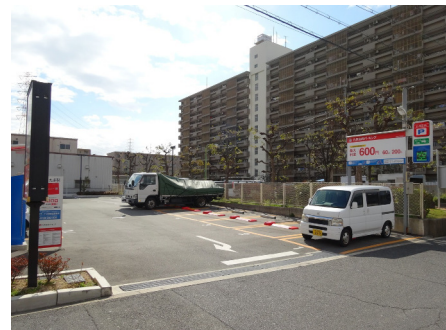
名鉄協商パーキング (大阪長吉長原)