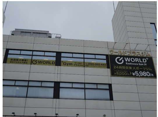
ワールドプラスジム (柏原店)