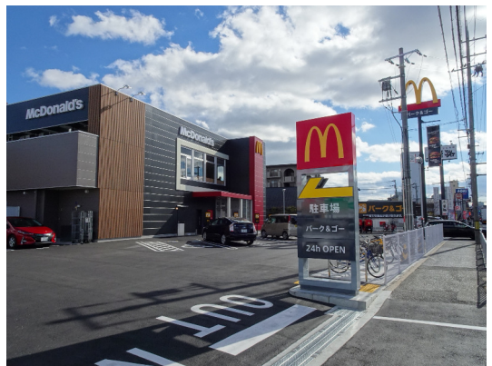
マクドナルド (茨木春日店)