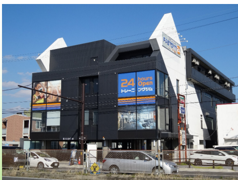
ファストジム24 (新守山店)