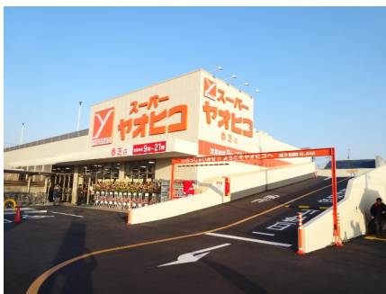
スーパーヤオヒコ (香芝店)