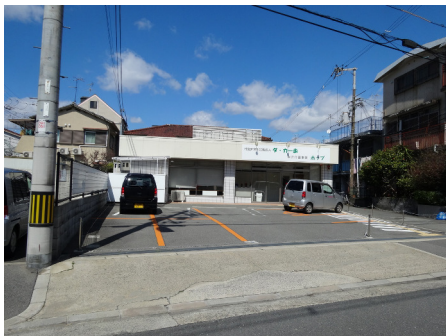
タ・カー歩 (大阪市淀川区)