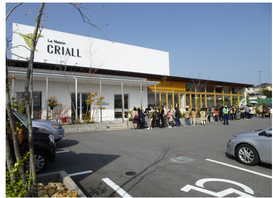
ラ・メゾン・クリオール (奈良市中登美ヶ丘)