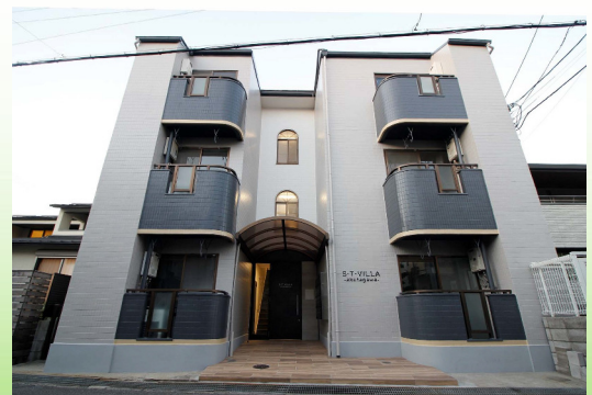
大阪府高槻市 マンション