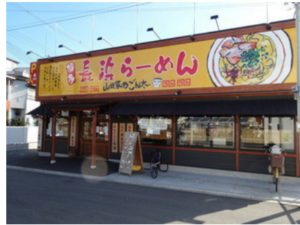
山田屋乃ごん太（東大阪大連店）