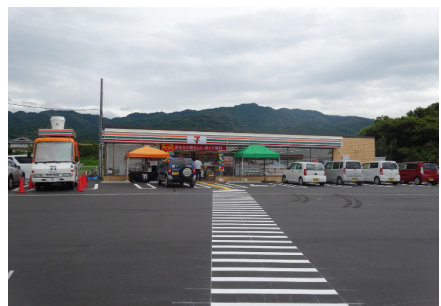
セブンイレブン (天理成願寺町店)