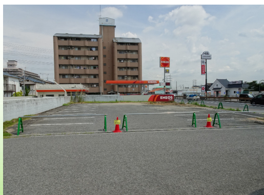
大阪府松原市田井城1丁目 自社所有地 (※売却済み)