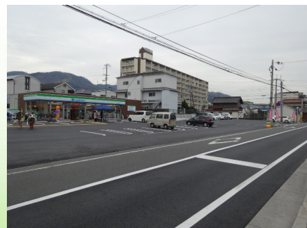
ファミリーマート (四条躰中野店)