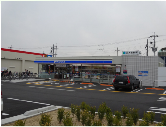
ローソン (八尾木の本1丁目店)