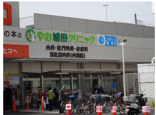
やお城田クリニック プラチナ薬局 (八尾市木の本)