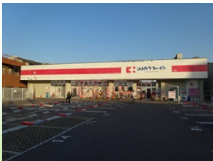
ココカラファイン（旭高殿店）