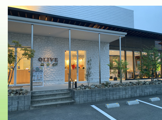
Deli&Buffet OLIVE (奈良市)