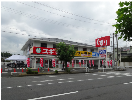
スギ薬局 (真美ヶ丘店)