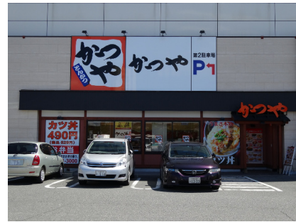
かつや (大阪柏原店)