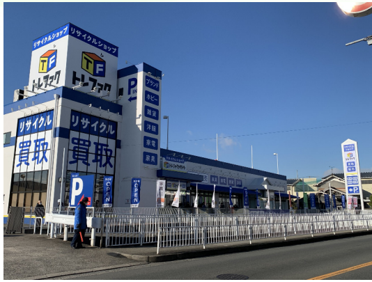
トレジャー・ファクトリー (東大阪箕輪店)