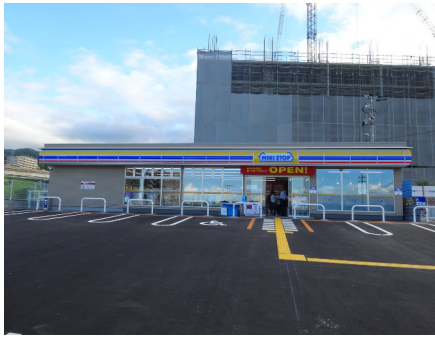
ミニストップ (茨木彩都あさぎ店)