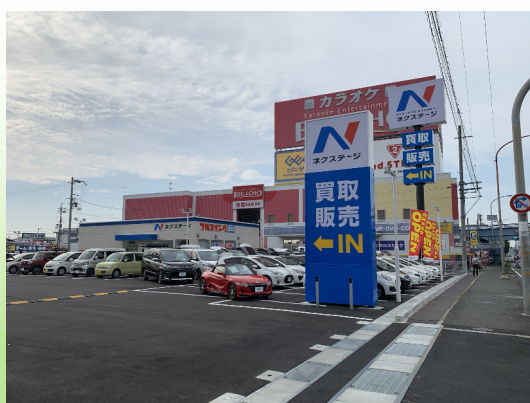
ネクステージ (藤井寺店)