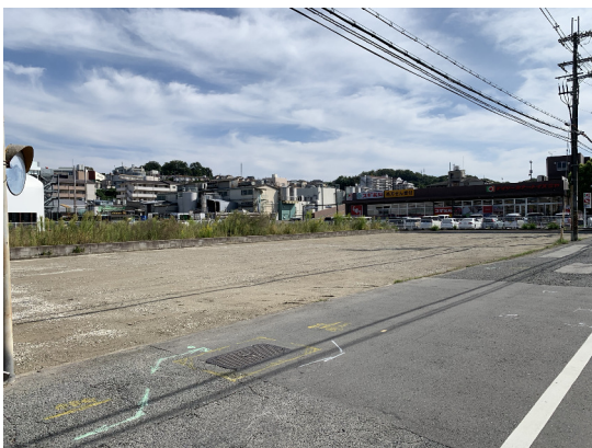
大阪府柏原市 複合店舗用地