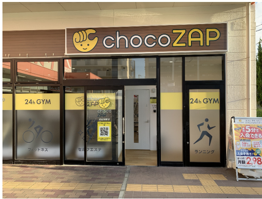
ちょこざっぷ (柏原駅前店)