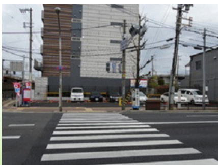
名鉄協商パーキング (吹田内本町)