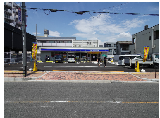
ローソン (陽光園二丁目店)