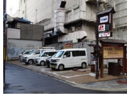
TOMOパーキング (河原町通三条)