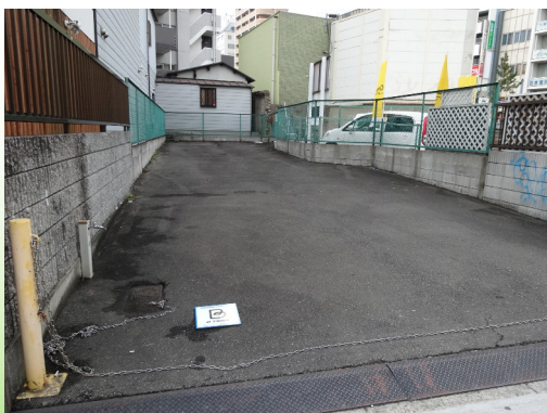
大阪市天王寺区 マンション用地