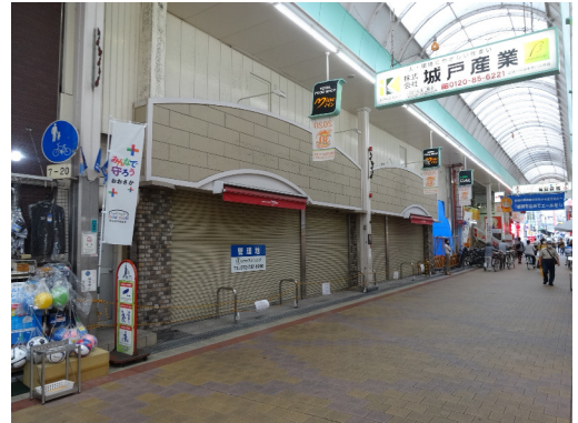
大阪府東大阪市 店舗用地