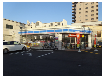
ローソン（関目4丁目店）