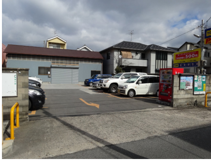
TOMOパーキング (東大阪本町)