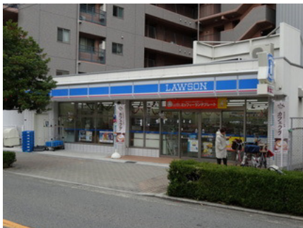
ローソン（南堀江4丁目店）