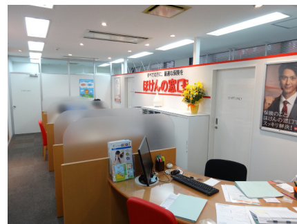
ほけんの窓口（江坂店）