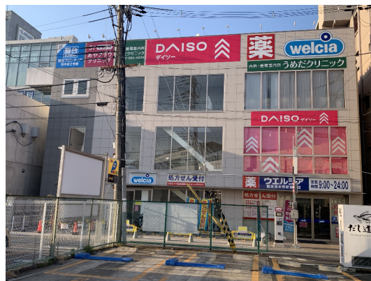
1F ウェルシア 2F ダイソー 3F 内科・婦人科・塾 (阪急茨木駅前)