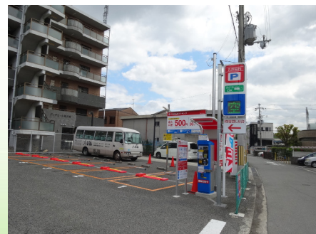
名鉄協商パーキング (藤井寺沢田2丁目)