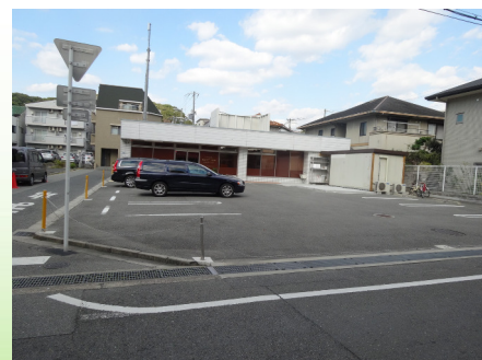
オヴァールリエゾン 菓子工房 (吹田市垂水町)