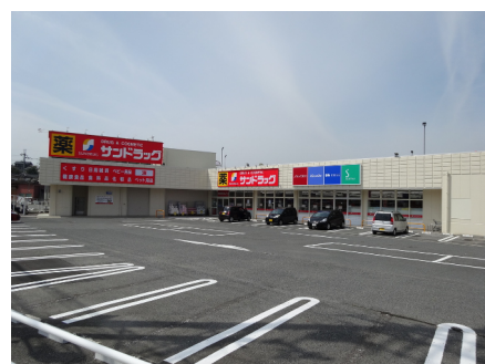
サンドラッグ (樺井店)