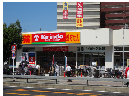
キリン堂（岸里駅前店）