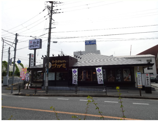
和食麺処サガミ (川西加茂店)