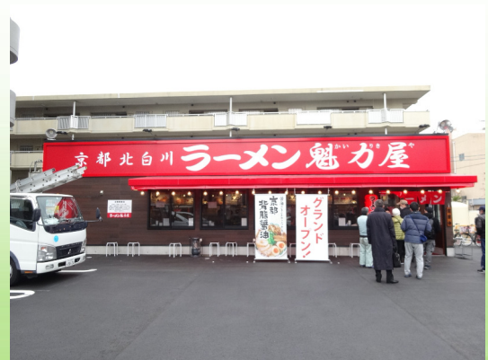
ラーメン魅力屋 (我孫子店)