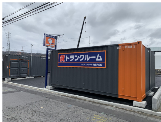
ハローステージ (柏原片山町)