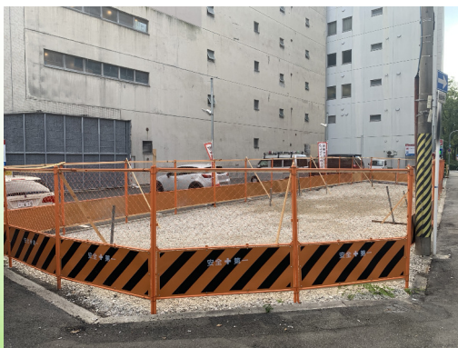
大阪市西区 事業用地