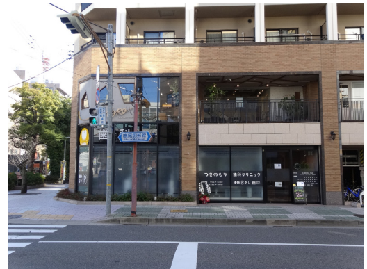
歯科医院 (兵庫県西宮市)