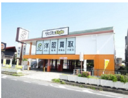
トレファクスタイル (宝塚店)