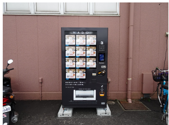
自動販売機設置 奈良県生駒市