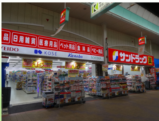
サンドラッグ (瓢箪山店)