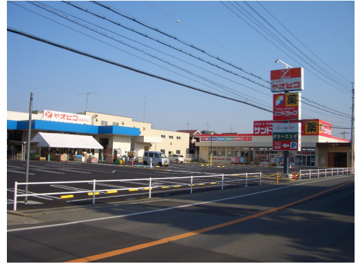
奈良県香芝市 オーナーチェンジ