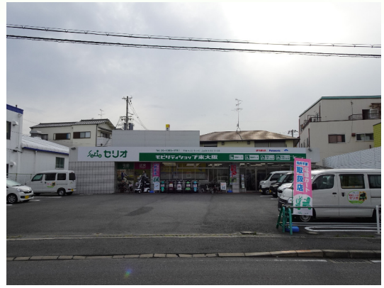
セリオ モビリティショップ 東大阪