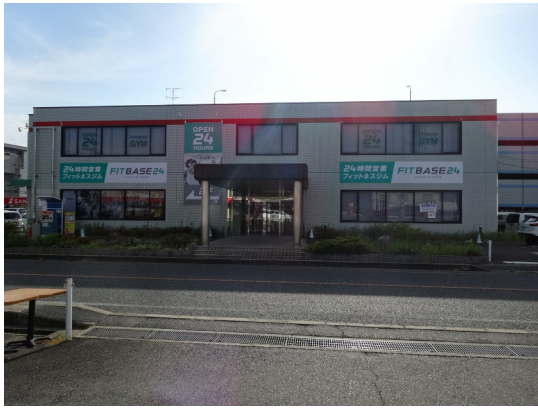
FIT BASE 24 (五位堂店)