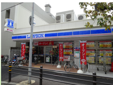
ローソン (蒲生4丁目駅前店)