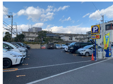
ザ・パーク (高槻市松原町2丁目)