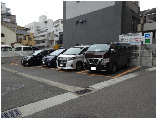
神戸市中央区 マンション用地