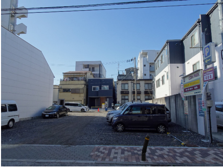
コインパーク (赤川一丁目)