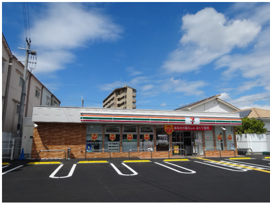
セブンイレブン (東大阪市玉串元町2丁目店)