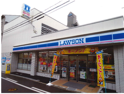
ローソン (蒲生1丁目店)