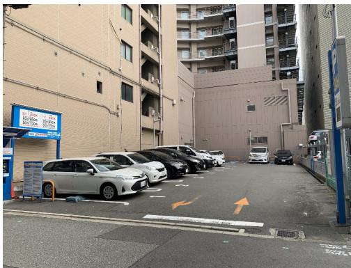
大阪市北区 事業用地