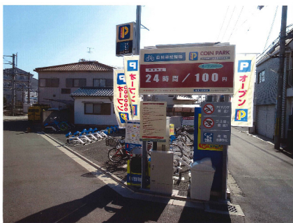
コインパーク 駐輪場 (大阪府吹田市)