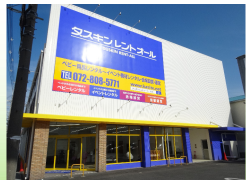
ダスキンのレンタル (枚方店)