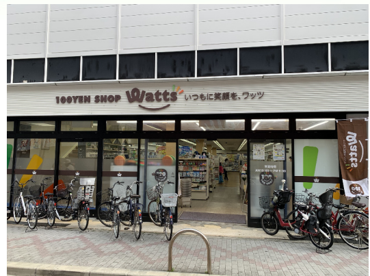
100円ショップ ワッツ (茨木阪急東中央店)