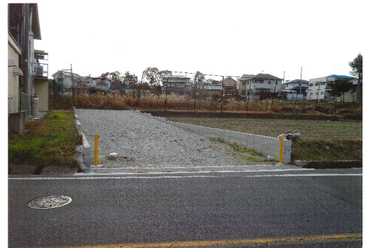
大阪府岸和田市 後面土地用の進入路買収