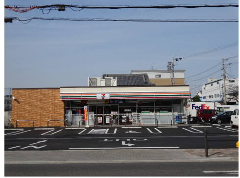
セブンイレブン (加美東2丁目店)