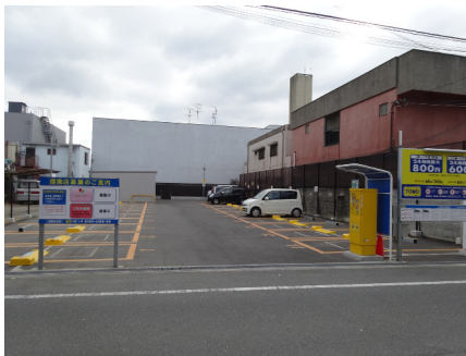
TOMOパーキング (鶴見区茨田大宮)