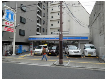
ローソン（道頓堀1丁目店）