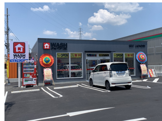
WASHハウス (柏原片山町店)