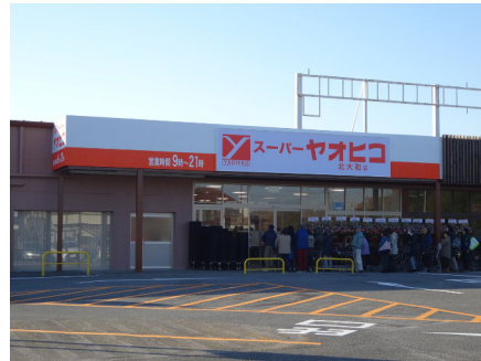
スーパーヤオヒコ (北大和店)