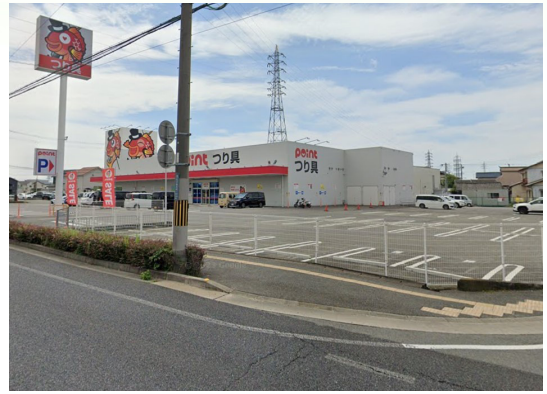
釣り具のポイント (姫路網干店) 駐車場