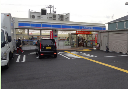
ローソン（片町1丁目店）