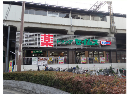
ドラッグセイムス (京阪大和田駅前店)