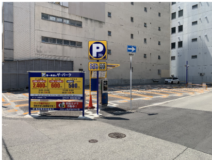
ザ・パーク (鞆本町1丁目)