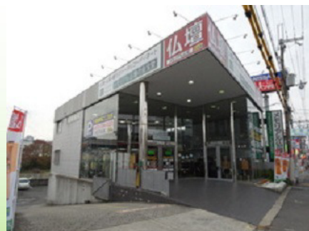
メモリアル仏壇（箕面店）