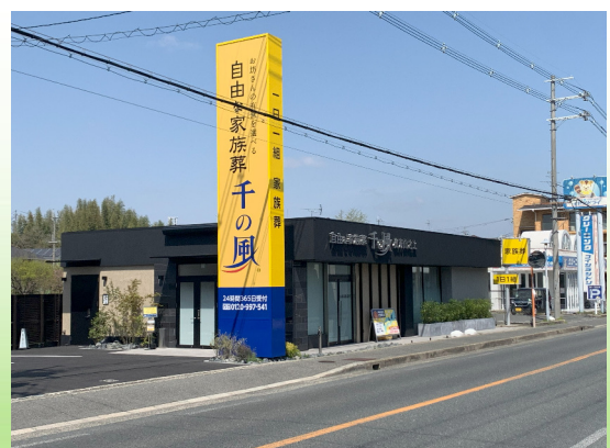
自由な家族葬 千の風 枚方山之上ホール