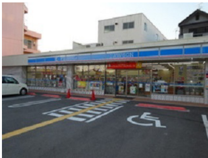
ローソン（太子橋1丁目店）