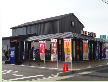
洋麺屋五右衛門（高松田村店）