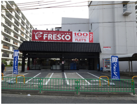
スーパーフレスコ（水尾店） オンセンド（水尾店）