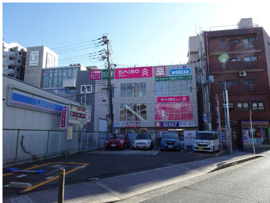
コインパーク (茨木双葉町)