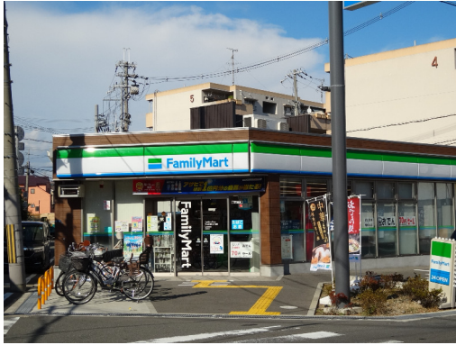
守口市金田町 オーナーチェンジ