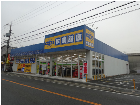
ワークショップ トータル (富田林店)