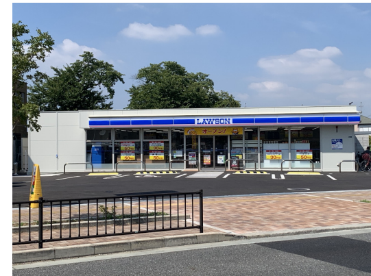
ローソン (岸部中五丁目店)