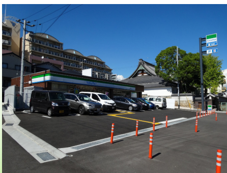
ファミリーマート (灘神前町店)