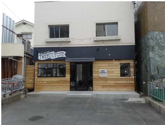
美容室 (大阪府吹田市)