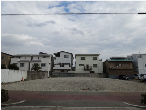
大阪市東住吉区 事業用地