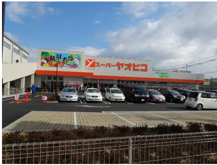
スーパーヤオヒコライフクリーナー (柏原本郷店)