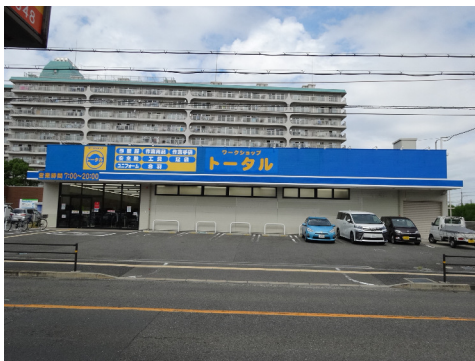
ワークショップ トータル (久宝寺店)