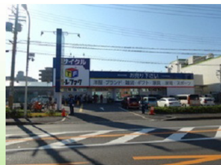
トレジャーファクトリー （東大阪店）