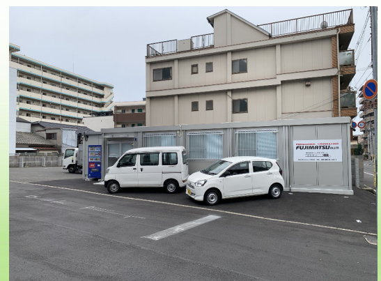
大阪市住吉区 事業所用地