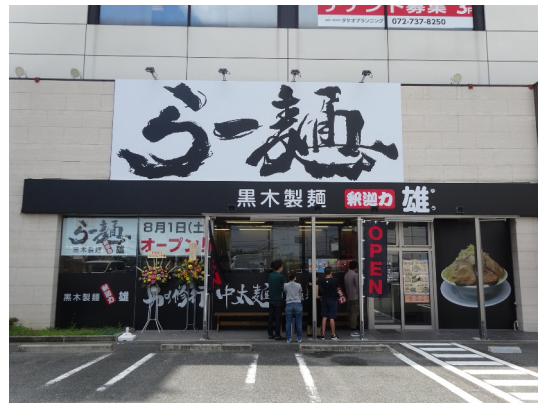
黒木製麺 頼む力 雄 (柏原店)