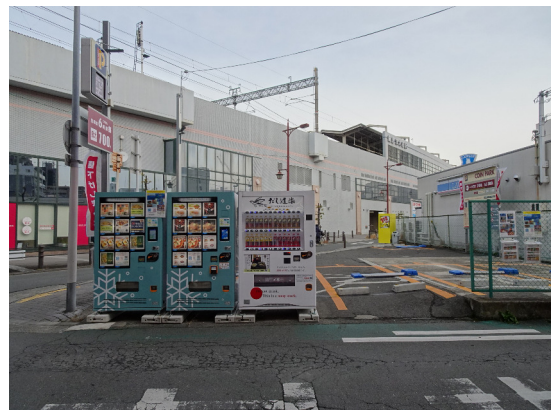
自動販売機設置 大阪府茨木市