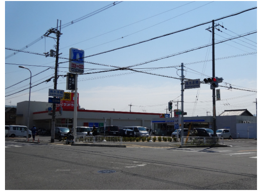
大阪府八尾市 土地（底地）売買