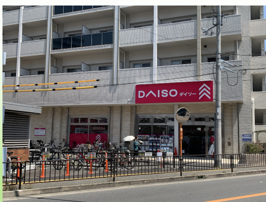
ダイソー (なかもす店)