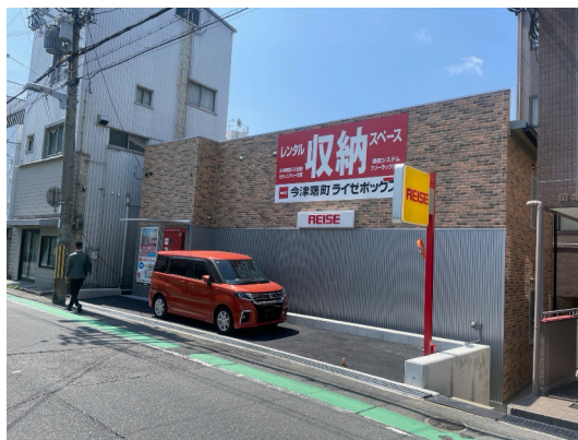
ライゼボックス (今津曙町)