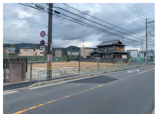
大阪府枚方市 土地売買