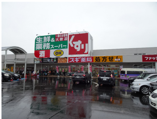
スギ薬局 (南生駒店)