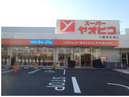
スーパーヤオヒコ（八尾木の本店）