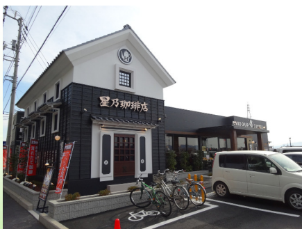
星乃珈琲店（高松田村町店）