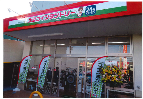
マンマチャオ（八尾木の本店）