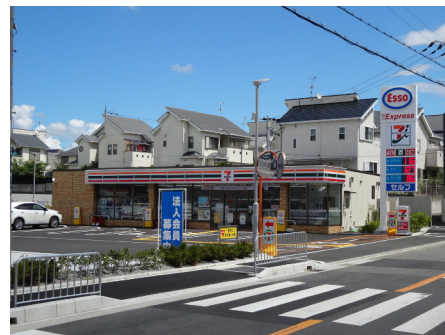
セブンイレブン (堺野田店)