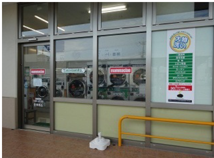
マンマチャオ（柏原店）