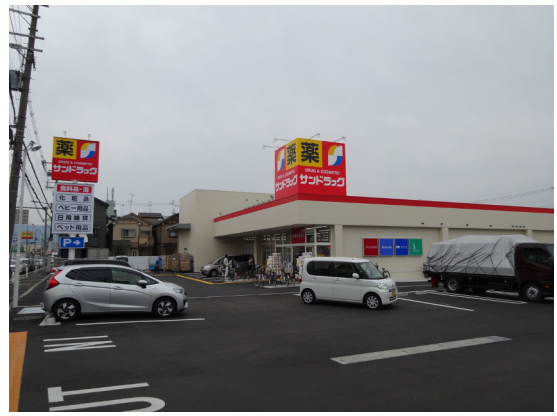
サンドラッグ (八尾木の本店)