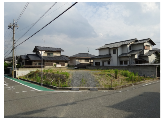
大阪府高槻市 戸建用地