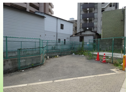
大阪市天王寺区 マンション用地