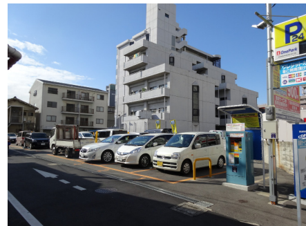
One Park (門真新橋町)